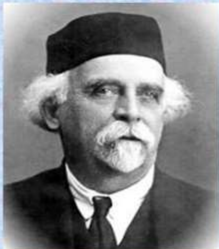
Николай Дмитриевич Зелинский (1861-1953 г.г.)

В качестве поглощающего элемента использовался древесный уголь. Первые испытания противогаза в боевых условиях прошли в августе 1915 года и подтвердили его высокую надежность.