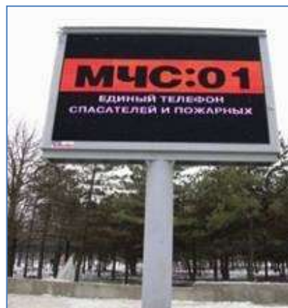
Пункты уличного информирования и оповещения населения (ПУОН)