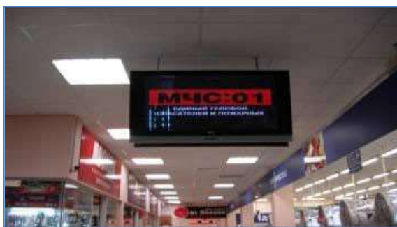
Пункты информирования и оповещения населения в зданиях с массовым пребыванием людей (ПИОН)